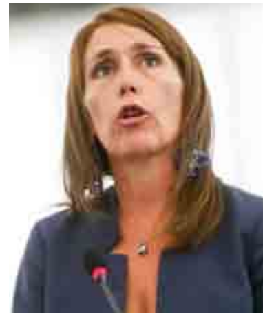
MoVimento 5 STELLE

Dal 2016 inizia la sua esperienza come consigliere politico del gruppo ENF (Europe of Nations and Freedom).